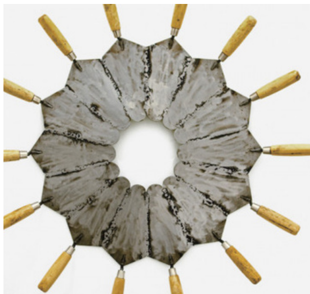
Obras da exposição 'A Quarta Geração Construtiva no Rio de Janeiro', em cartaz na FGV Arte.

Na abertura do FGV ARTE também ocorreu o lançamento do livro “Rio XXI Vertentes Construtivas”, que é o segundo volume da coleção Rio XXI, seu conteúdo relaciona as gerações precursoras aos movimentos contemporâneos. A mostra gratuita ficará disponível para visitação até novembro, de segunda a sexta, de 10 às 20h; e aos sábados e domingos, 10 às 18h.