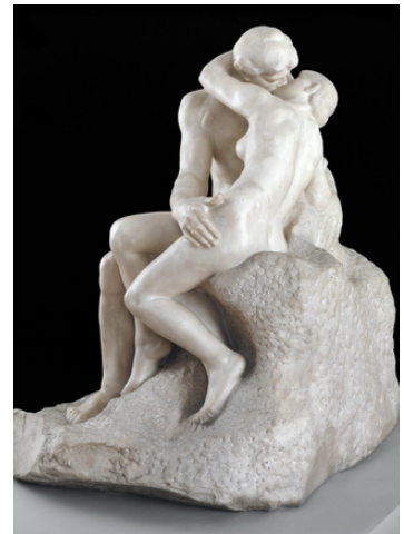
"O Beijo", escultura em mármore de Auguste Rodin, 1888-1889

Duas renomadas figuras da arte, Gustav Klimt e Auguste Rodin, immortalizaram o tema do amor e da intimidade em suas obras intituladas "O Beijo". Apesar de compartilharem esse título, as criações desses artistas são distintas em estilo, movimento artístico e contexto histórico. A obra de Gustav Klimt, "O Beijo",