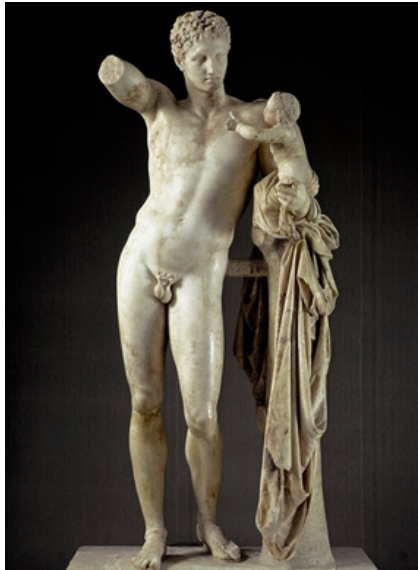
Hermes e Dionísio criança - Praxíteles (século IV a.C.)

Destaques: Fídias, Policleto, Praxíteles, Polidoro, Míron.