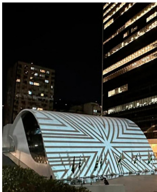
Edifício da FGV ARTE, localizada em Botafogo/RIO

Com uma exposição de lançamento sobre as gerações construtivas na arte do século XXI, no dia 11 de setembro a FGV inaugurou um espaço destinado à arte e cultura. São 46 artistas contemporâneos que estão expondo no evento. A proposta do espaço é a valorização e experimentação artística, além de oferecer debates contemporâneos em torno da arte e da cultura. Com isso visa incentivar o diálogo com setores mais criativos e heterogêneos da sociedade. O novo espaço está localizado na sede da FGV,