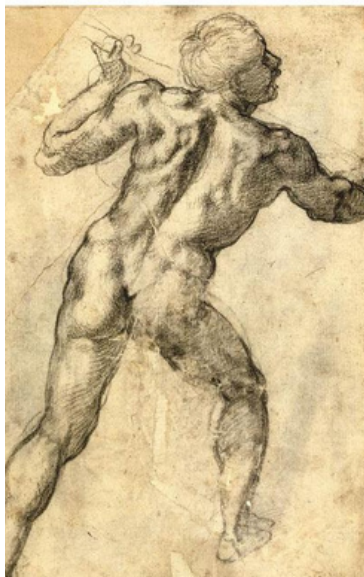
"Homem nu, visto de costas (recto)" Michelangelo Buonarroti - lápis - 282 x 203 cm - 1503 - (Musée du Louvre (Paris, France)

A descoberta de uma jazida de grafite no século XVI, na Inglaterra, abriu novas possibilidades para o que se desenhava, até então, usando a própria tinta diluída e pincel, ou giz. Por volta de 1660, em Nuremberg, Alemanha, são produzidos em série, na versão do grafite introduzido em bastões ocios de madeira. Substituíram as barras de grafite envoltas em corda ou pele de carneiro, dando mais facilidade em seu uso ao artista. Mas é à França, que os desenhistas devem o surgimento, em 1795, do chamado lápis moderno, criado por Nicolas-Jacques Conté, que se vale da mistura de argila com pó de grafite, embalada em haste de madeira. Identificados de acordo com sua maciez relativa /dureza, ganharam variedades: 4B/3B – pretos e macios; 5H/2H- duros; HB- média textura. O domínio do desenho a lápis precedia a criação das obras de muitos dos grandes mestres.