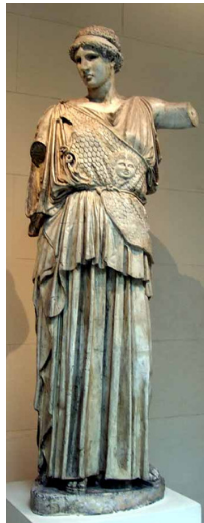
Atena Lêmnia, Fídias, criada por volta de 451 a.C.