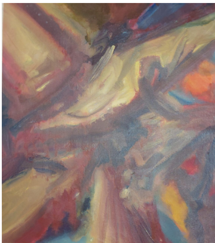
Sem título Acrílica sobre tela 62 x 53 R$ 1.600,00