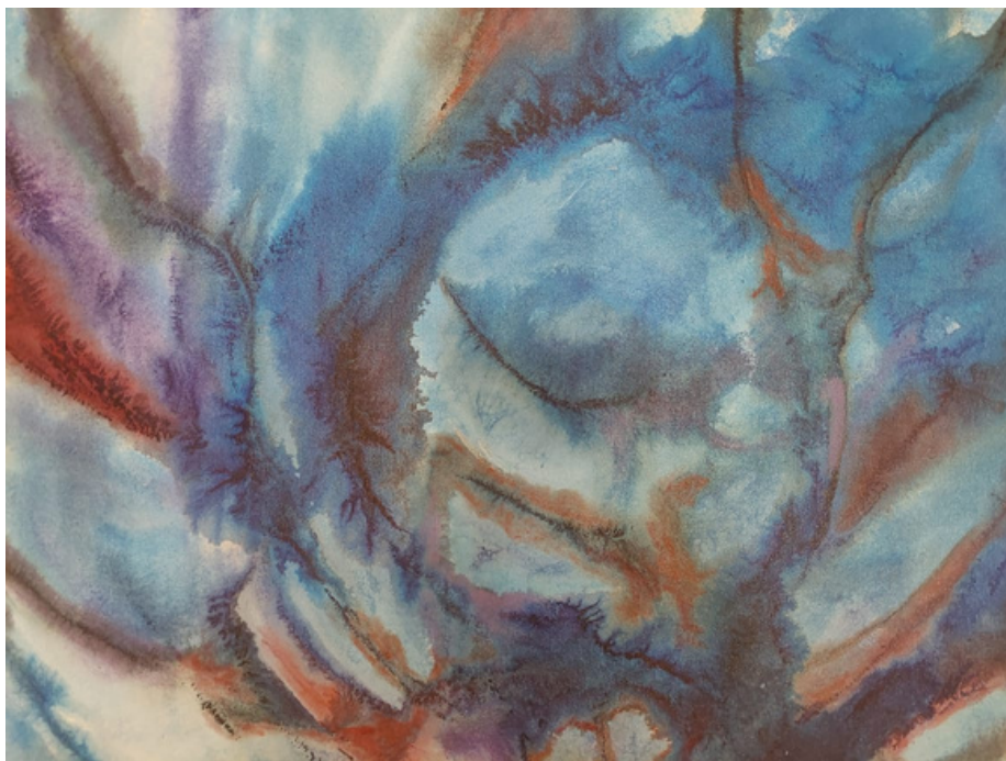
Sem título Acrílica sobre tela 67 x 86 R$ 1.800,00