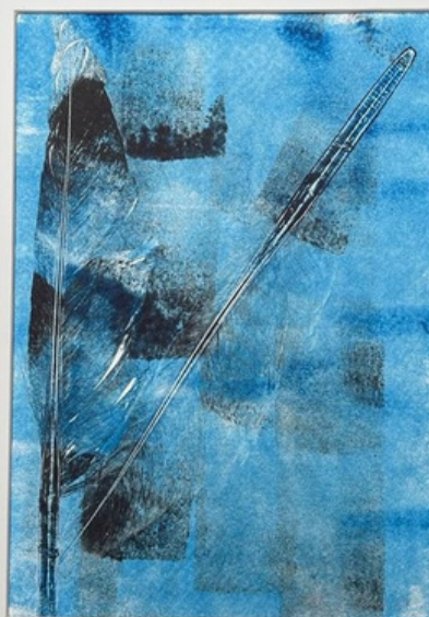
Ventania Gravura (única) em monotipia sobre papel Hahnemühle 300gr 42 x 33 R$ 860,00