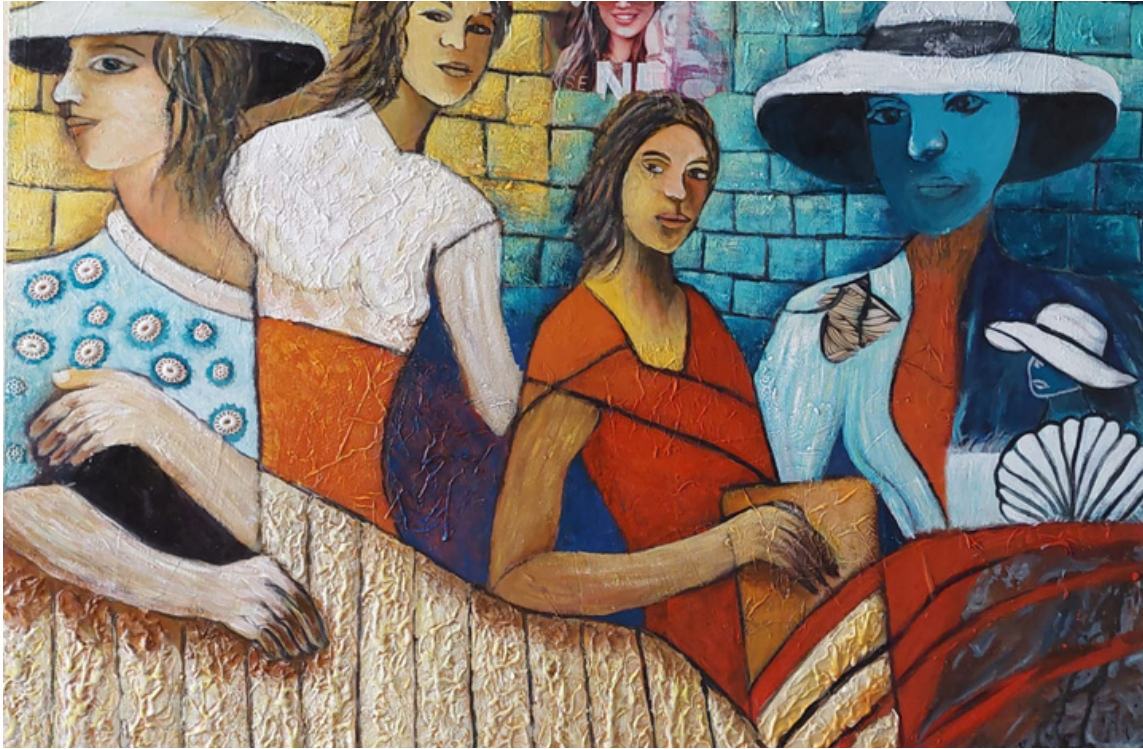
Lindas mulheres Técnica mista com texturas 80 x 110 R$ 3.500,00