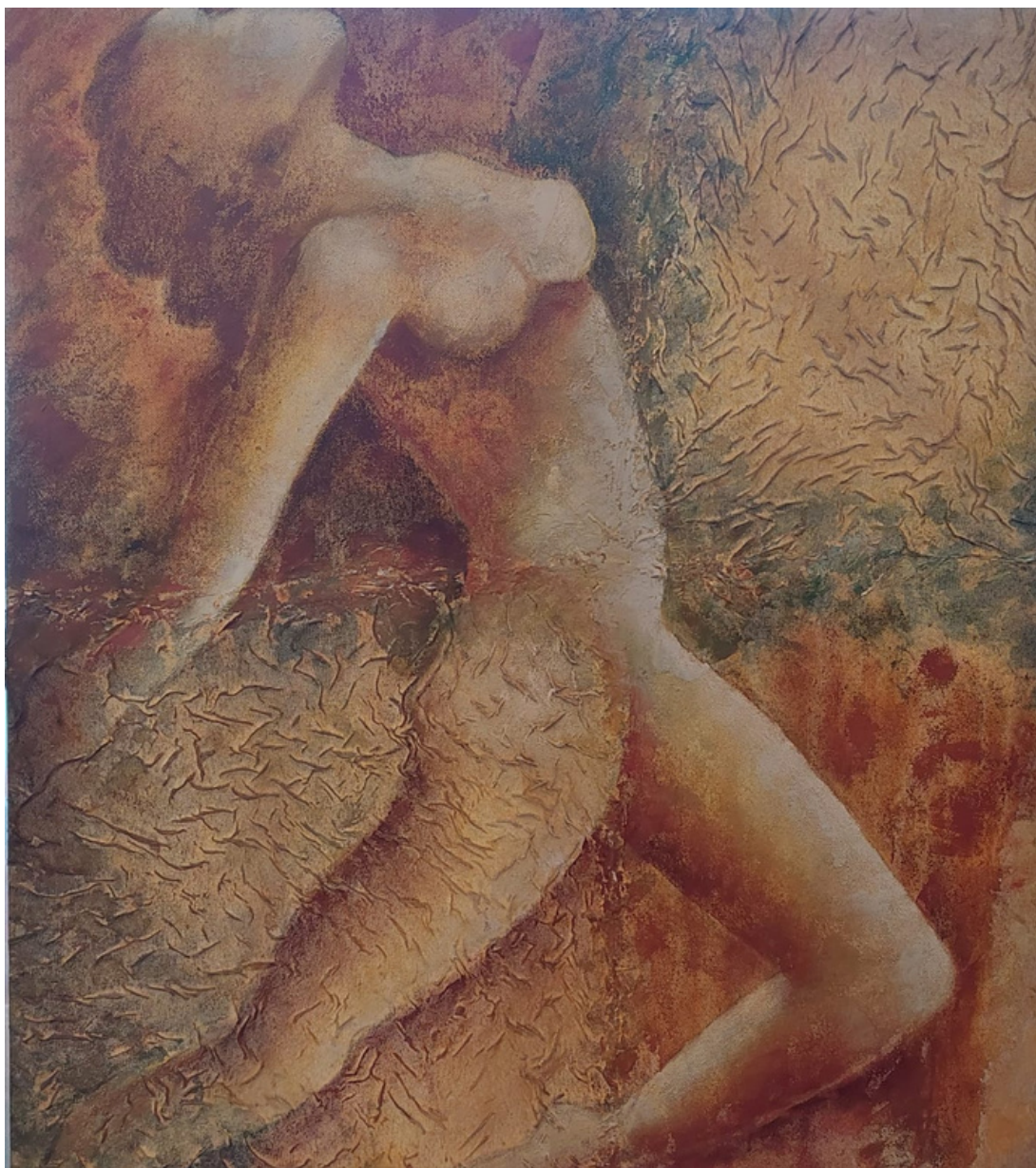
Caminhar Acrílica sobre renda 79 x 79 R$ 3.500,00