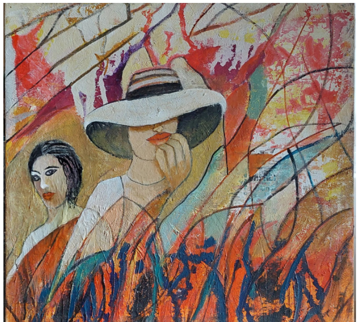
Sem título Acrílico sobre tela 79 x 79 R$ 3.000,00