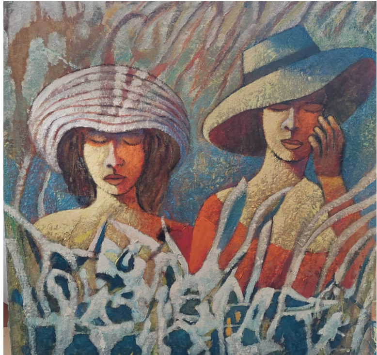
Reflexo Acrílica sobre tela 79 x 79 R$ 2.500,00