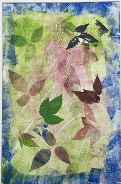
Folhagens Gravura (única) em monotipia sobre papel Hahnemühle 300gr 60 x 43 R$ 960,00