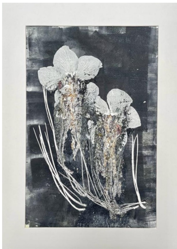
Final de primavera Gravura (única) em monotipia sobre papel Hahnemühle 300gr 60 x 43 R$ 960,00