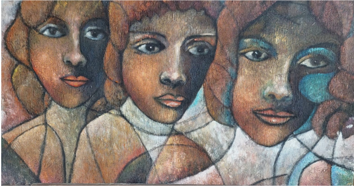
Mulheres Africanas Acrílica sobre tela 44 x 85 R$ 1.500,00