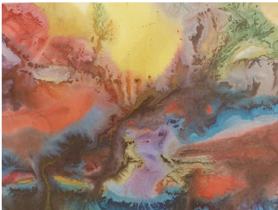
Sem título Acrílica sobre tela 50 x 70 R$ 1.400,00