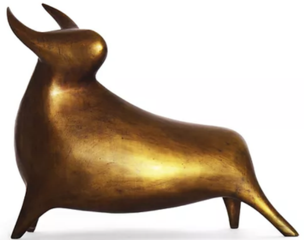
Força Bronze 12x26 R$ 3.100,00