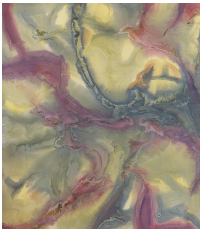
Sem título Acrílica sobre tela 68 x 61 R$ 1.600,00