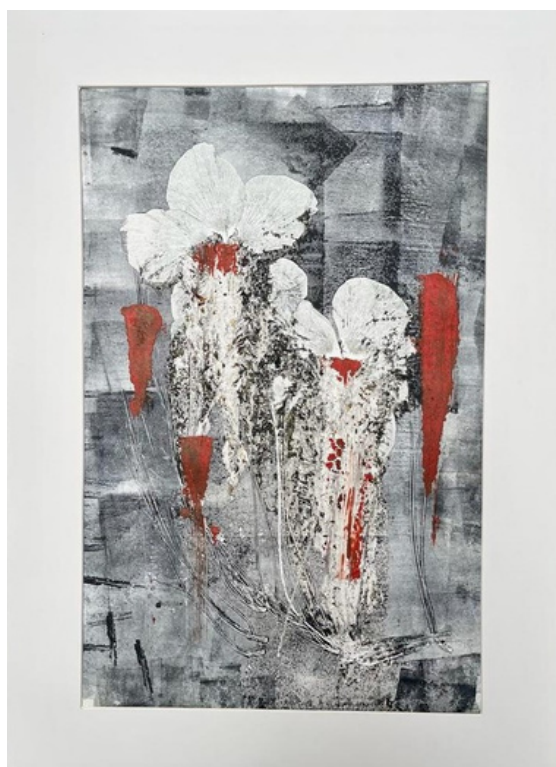
Florescer Gravura (única) em monotipia sobre papel Hahnemühle 300gr 61 x 44 R$ 960,00