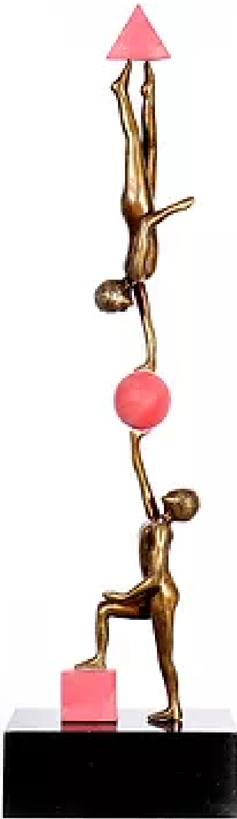
Equilíbrio das formas Resina 100x20 R$ 4.600,00