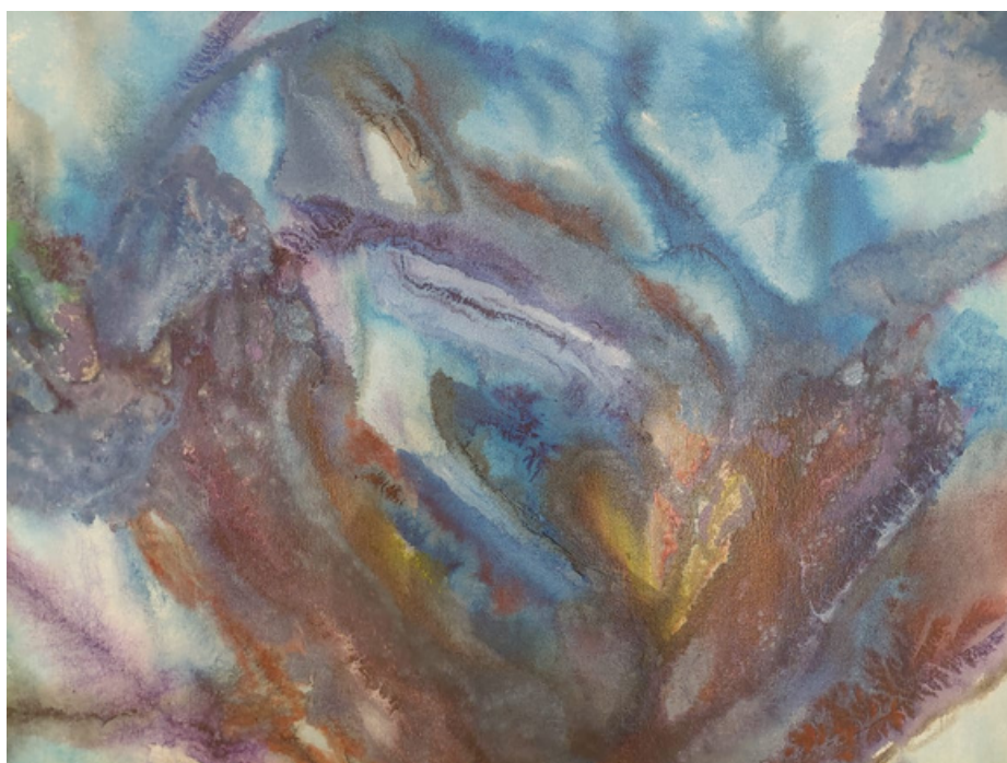
Sem título Acrílica sobre tela 67 x 86 R$ 1.800,00