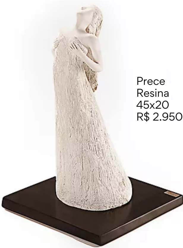
Prece Resina 45x20 R$ 2.950,00