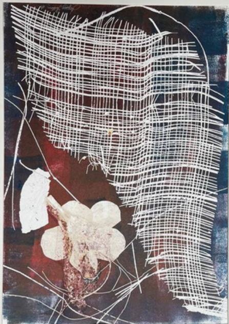
Tramas Gravura (única) em monotipia sobre papel Hahnemühle 300gr 55 x 41 R$ 860,00