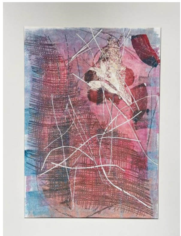
Incógnito Gravura (única) em monotipia sobre papel Hahnemühle 300gr 54 x 42 R$ 860,00