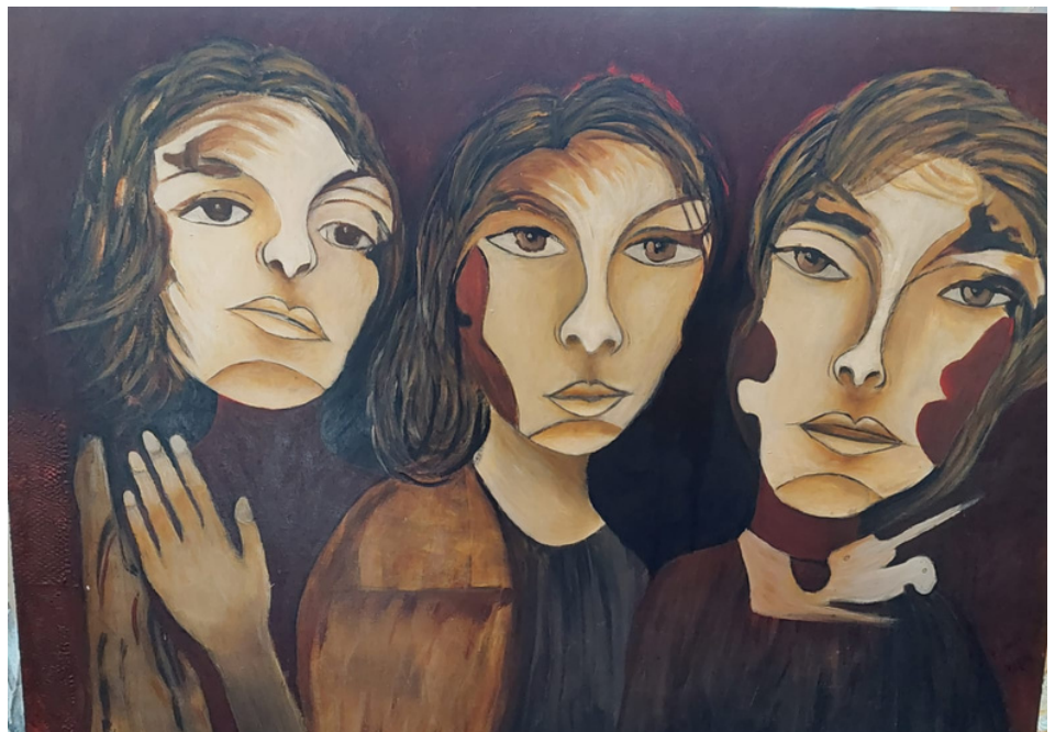
Cubismo Acrílica sobre tela 79 x 89 R$ 3.000,00