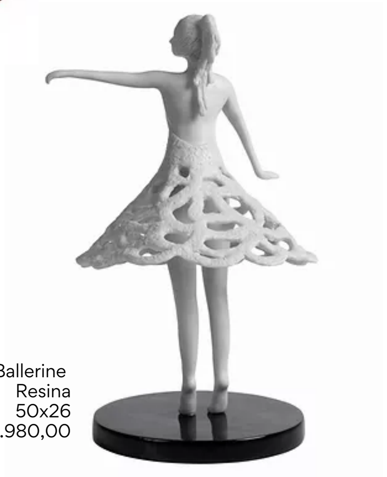
Ballerine Resina 50x26 R$ 2.980,00