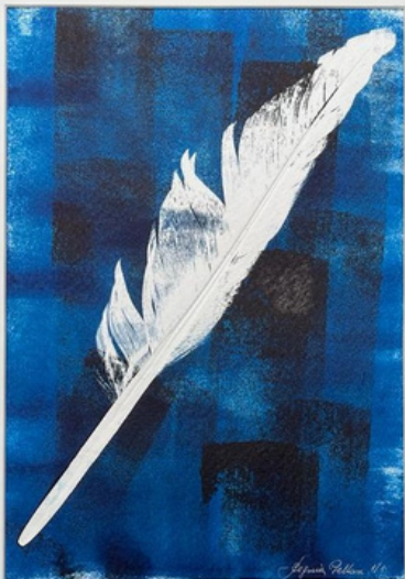
Leveza Gravura (única) em monotipia sobre papel Hahnemühle 300gr 42 x 37 R$ 860,00