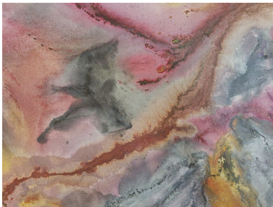
Sem título Acrílica sobre tela 26 x 38 R$ 700,00