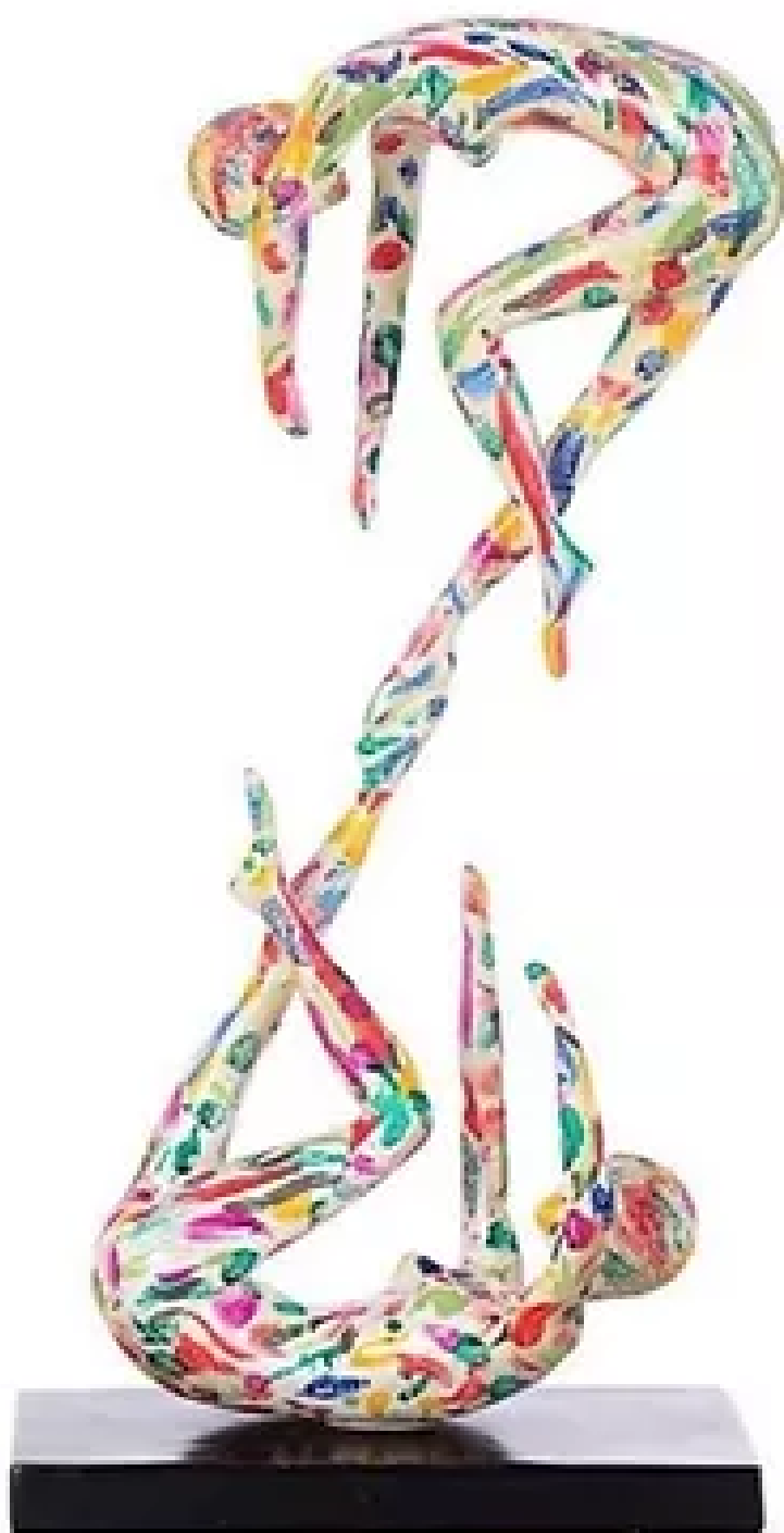
Ninfa II color Resina 60x23 R$ 2.950,00