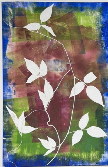
Hera Gravura (única) em monotipia sobre papel Hahnemühle 300gr 60 x 43 R$ 960,00