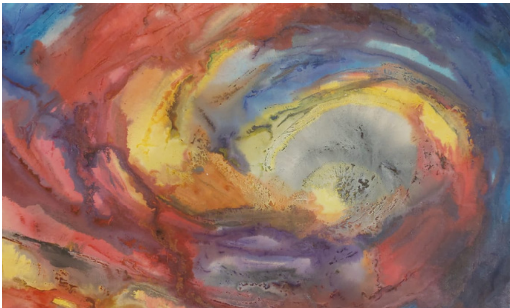
Sem título Acrílica sobre tela 51 x 88 R$ 2.100,00