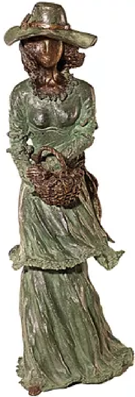
Dama antiga Bronze 50x26 R$ 4.200,00