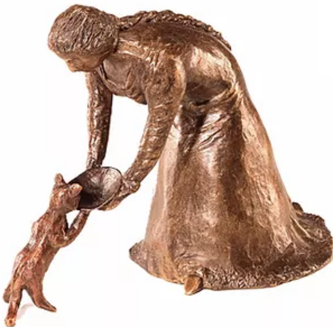
A mulher e o gato Bronze 35 x 18 R$ 3.900,00