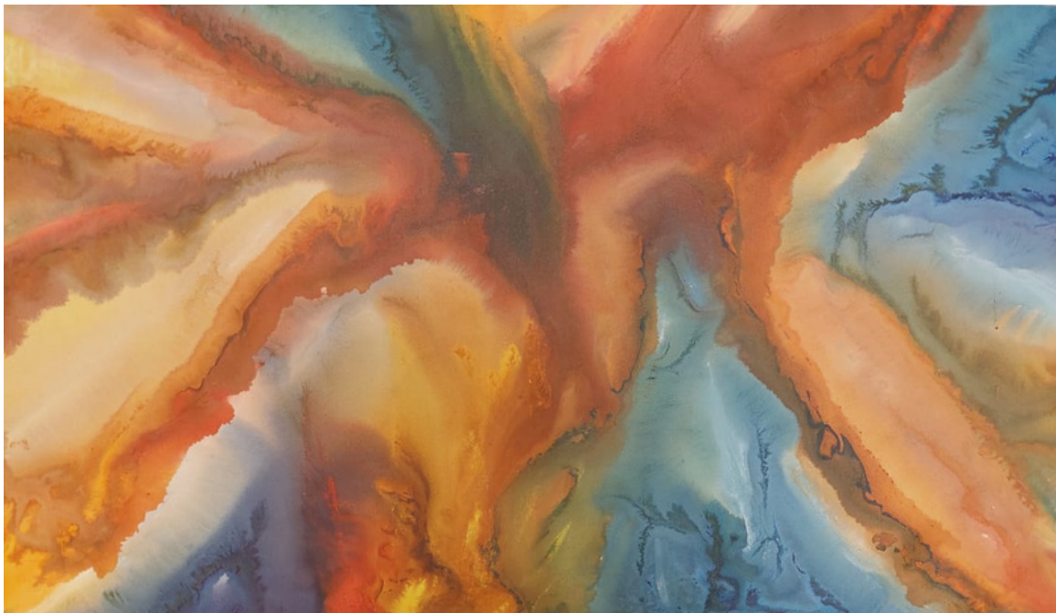
Sem título Acrílica sobre tela 55 x 103 R$ 3.200,00