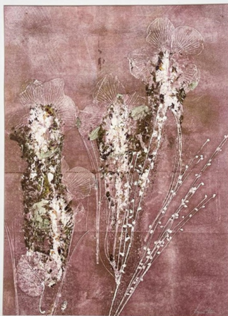
Resquícios de uma estação Gravura (única) em monotipia sobre papel Hahnemühle 300gr 66 x 52 R$ 960,00