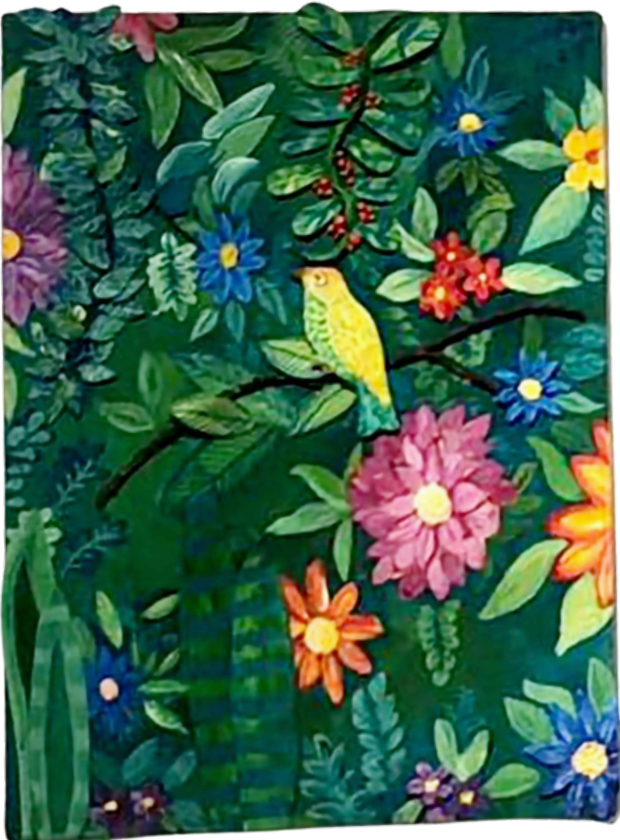
Crisântemo Rosa 61x45 R$2900,00