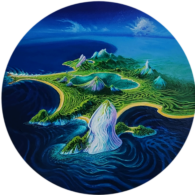
Decolando ao amanhecer Acrílica s/tela 50cm de diâmetro R$4.300,00