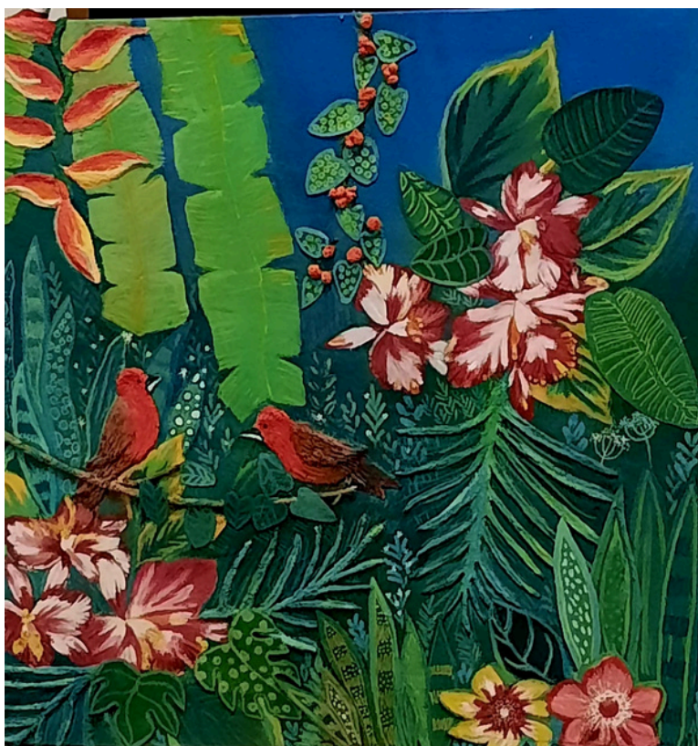
Tiê Sangue 50x50 R$2000,00