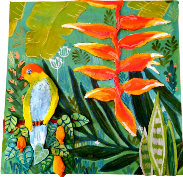
Philodendro 30x30 R$800,00