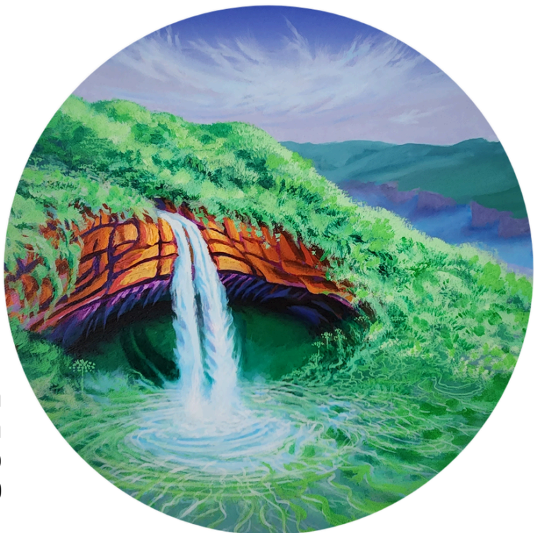
Espiral da vida Acrílica s/tela 100cm de diâmetro R$7.500,00