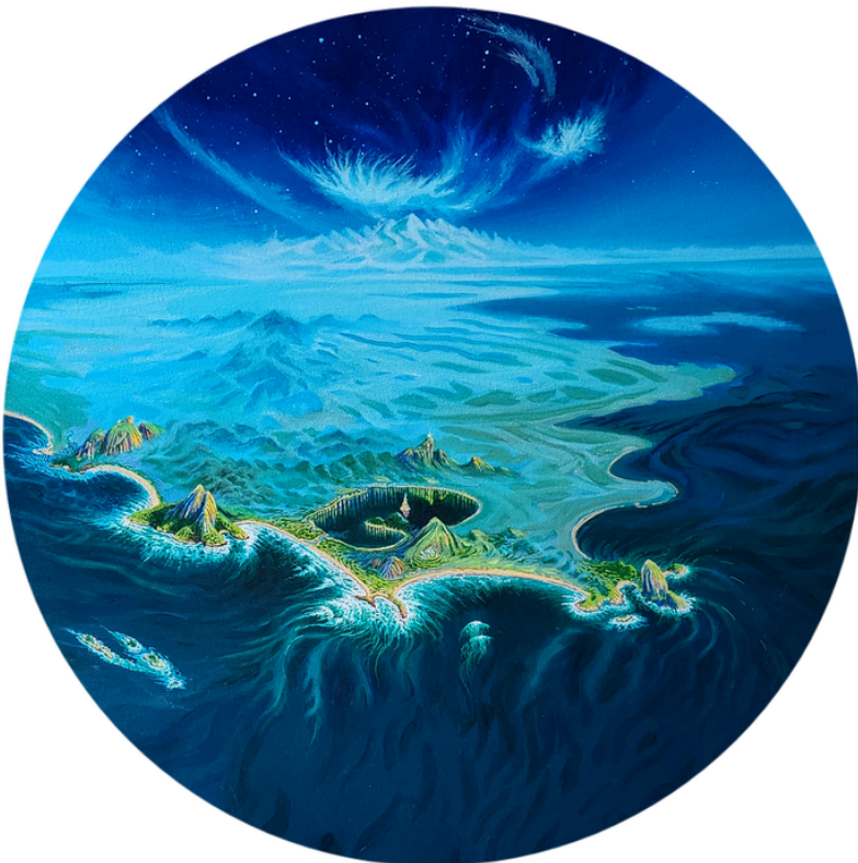
Minha Alma Canta Acrílica s/tela 60cm de diâmetro R$5.500,00