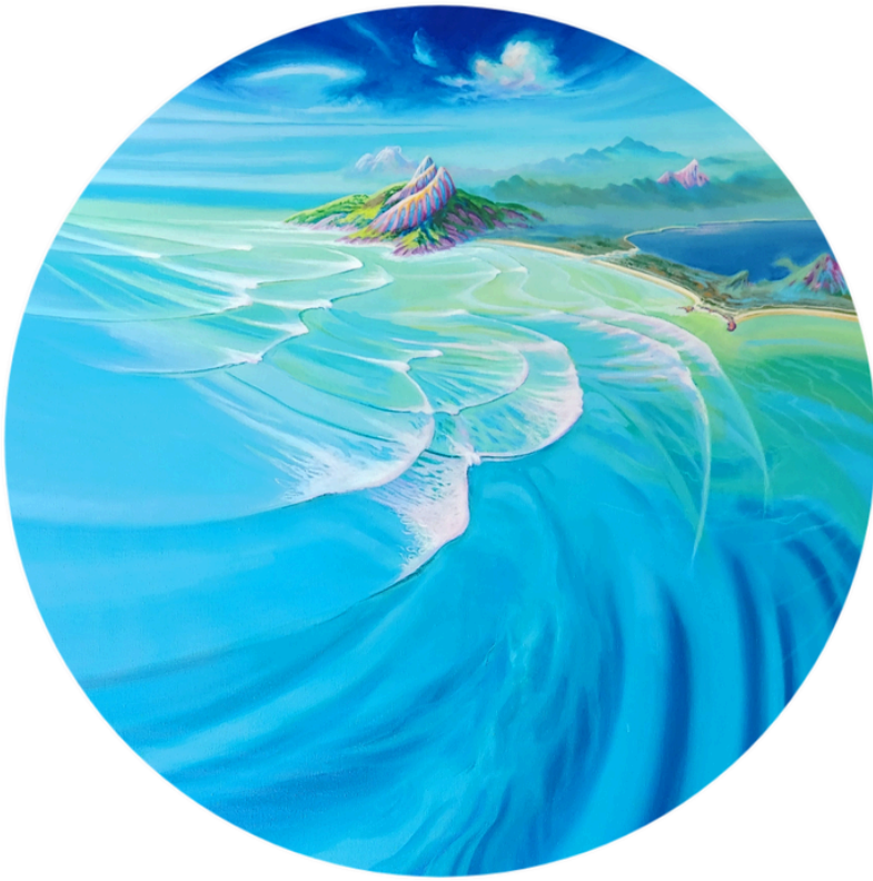
Frente Fria Acrílica s/tela 90cm de diâmetro R$6.900,00