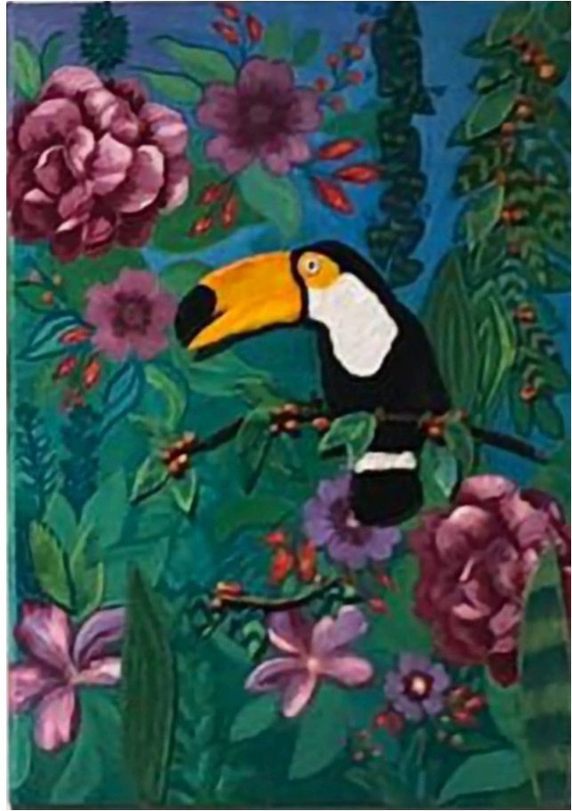
Tucano 61x45 R$2900,00