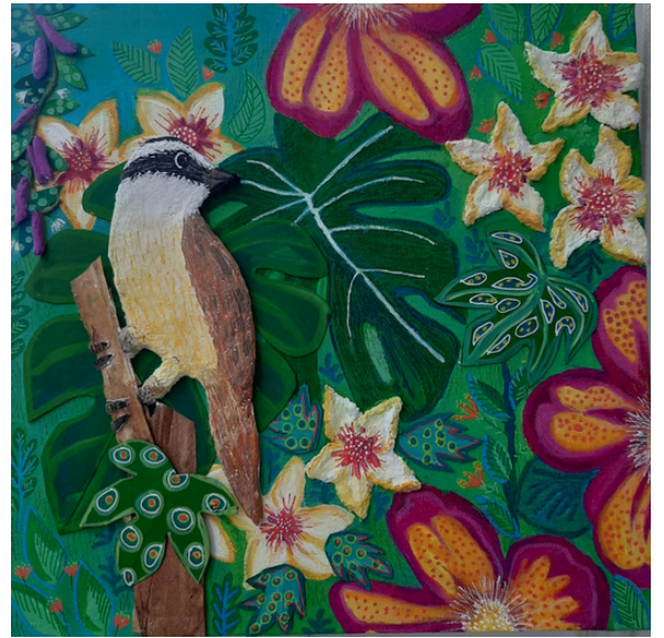
Bem-te-vi 30x30 R$800,00