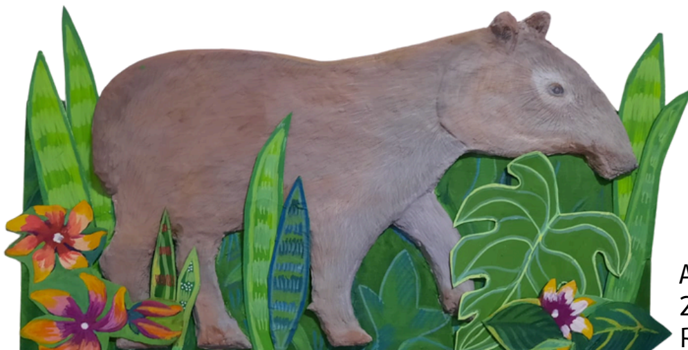
Anta 28x48 R$750,00