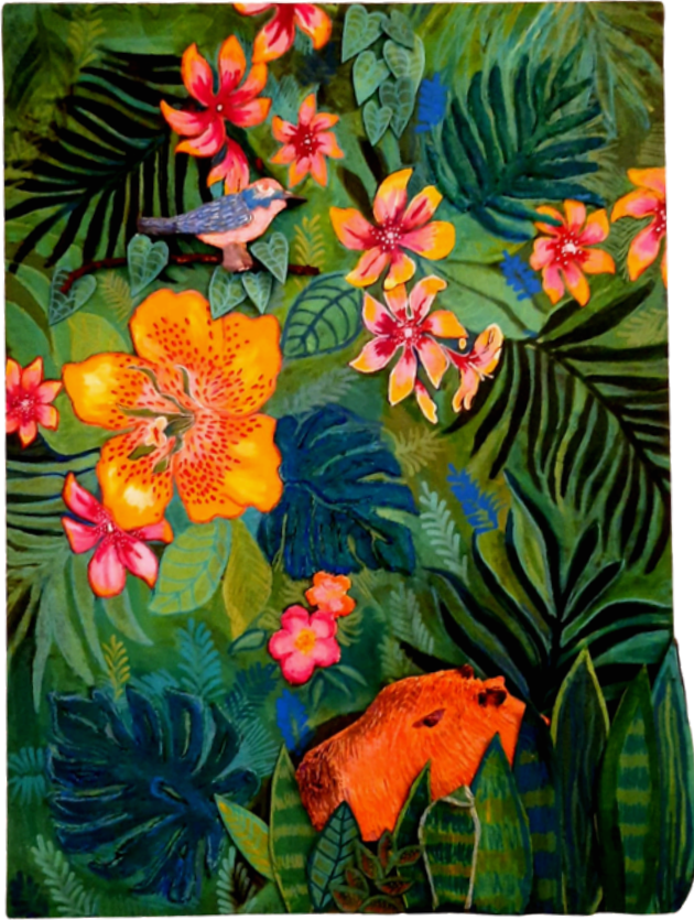
Capivara 61x45 R$2900,00