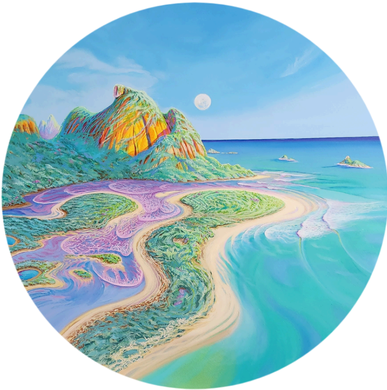
VOLARE Acrílica s/tela 100cm de diâmetro R$7.500,00