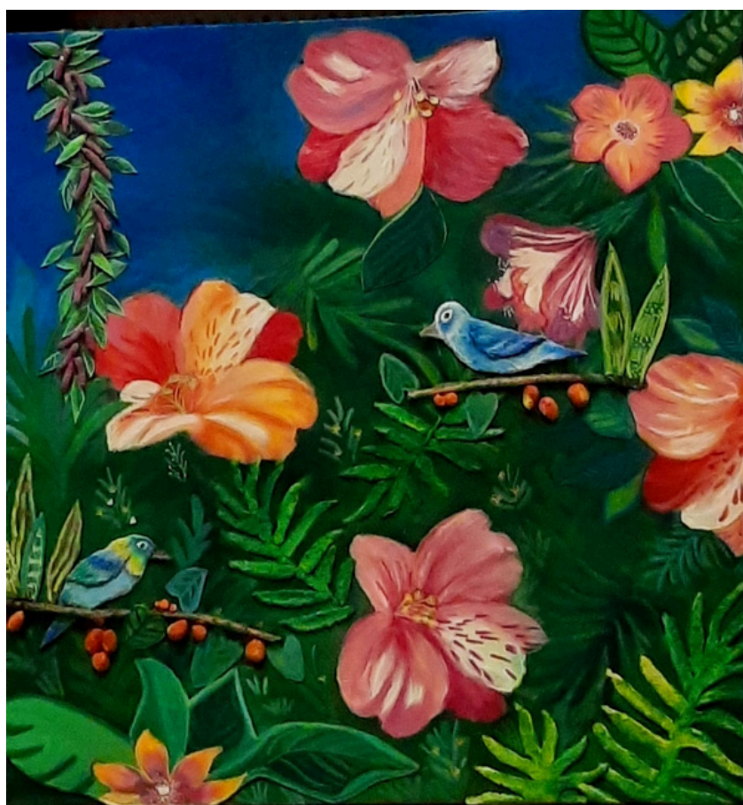
Sanhaço 50x50 R$2000,00