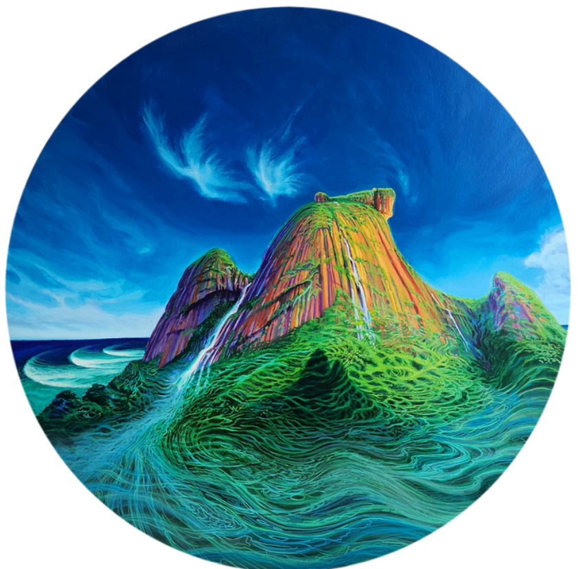
Fraternidade Acrílica s/tela 90cm de diâmetro R$6.900,00