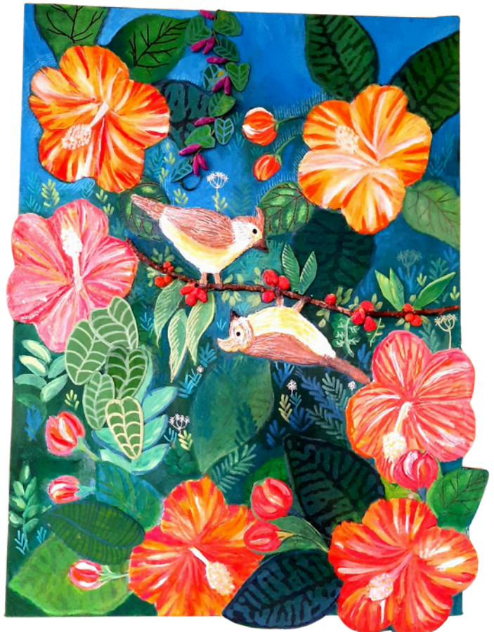
Chapim 61x45 R$2900,00