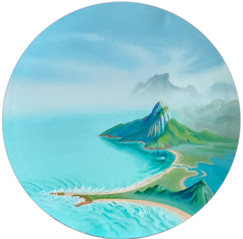
Miragem do Princípio Acrílica s/tela 50cm de diâmetro R$4.450,00