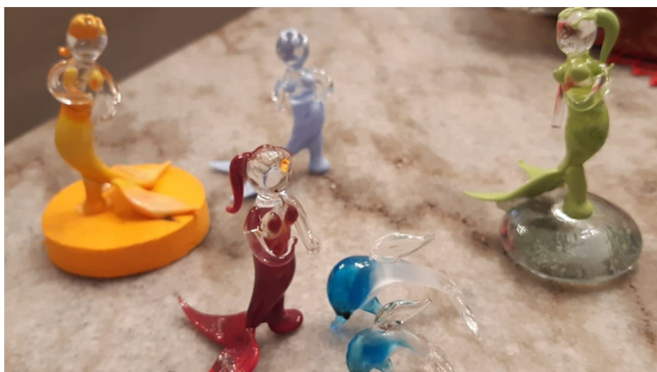
Sem título Vidro com pigmento 8 cm R$ 85,00