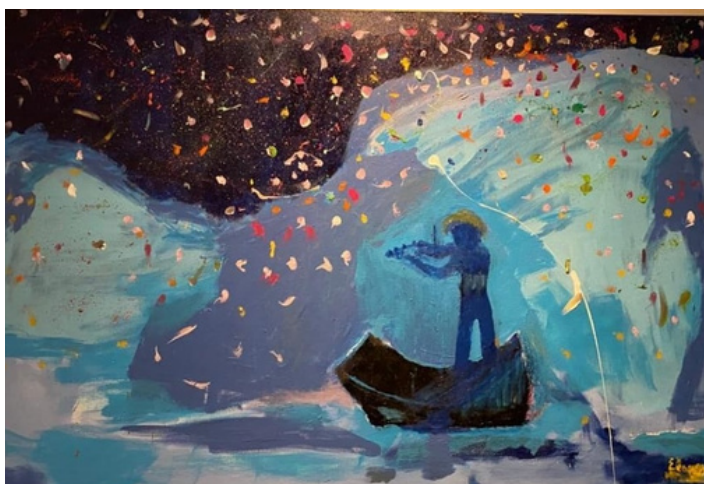
Arte e estrelas Acrílica sobre tela 60 x 90 R$ 2.300,00

Em 2022 expôs na coletiva presencial "A arte é meu mundo", na Mblois Galeria de Arte.