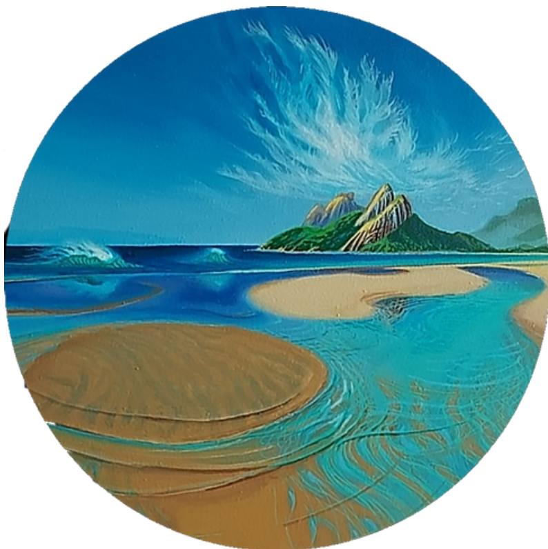
Pacificar o espírito Acrílica sobre tela 30 cm diâmetro R$ 2.500,00