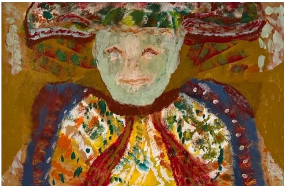
Toureiro Acrílica sobre tela 50 x 60 R$ 1.700,00