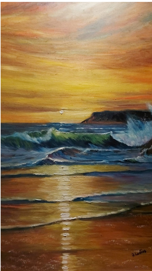
Crepúsculo Óleo sobre tela 70 x 50 R$ 2.000,00

Seu nome figura em repertórios de artes como “Artes Plásticas Brasil 1997 - seu mercado seus leilões” - vol. 9.