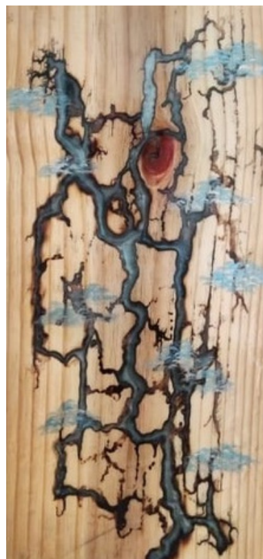
Bonsai social Madeira pinus, resina e tinta acrílica 60 x 29 R$ 1.500,00