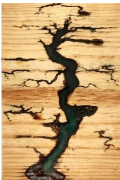
Pequeno bonsai Madeira pinus e resina 30 x 20 R$ 518,00