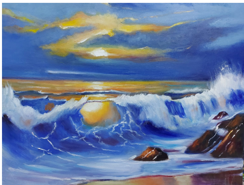
Sem título Óleo sobre painel 40 x 50 R$ 1.500,00