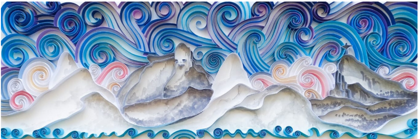
Belezas do Rio Técnica mista quilling e aquarela 60 x 20 R$ 700,00

Considerada a arte milenar, o quilling é uma técnica que trabalha com papel, usando tiras de papel de diferentes cores e gramaturas que são enroladas e modeladas para formar ilustrações de grande complexidade.