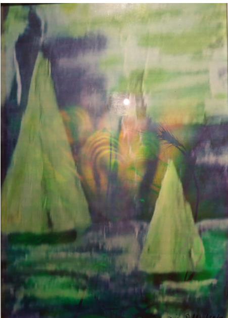
Plantas aquáticas e barcos Holograma Arte 30 x 20 R$ 1.550,00

Desde 2018, EICHLER expõe na Mblois Galeria, da qual é Artista exclusivo .