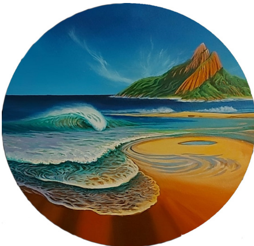
Pés descalços na areia molhada Acrílica sobre tela 39,5 de diâmetro R$ 3.500,00