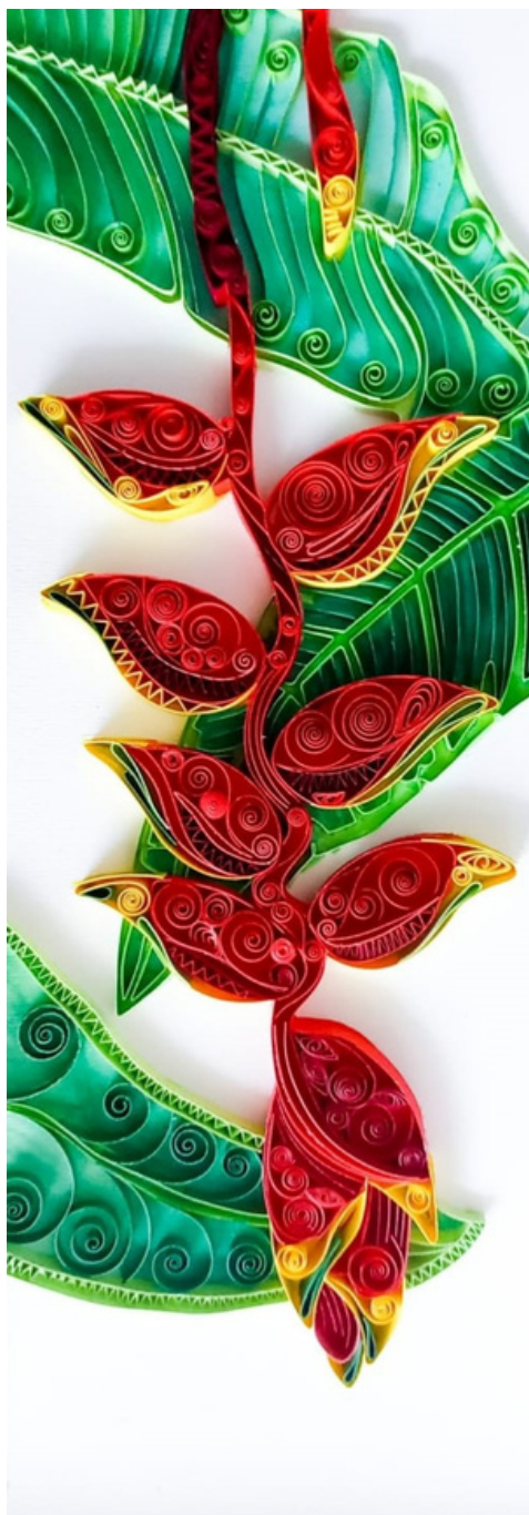
Helicônia Técnica mista quilling e aquarela 60 x 20 R$ 700,00