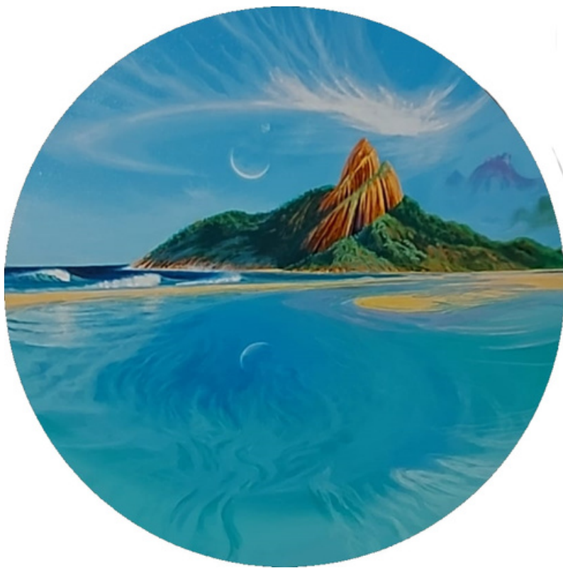
Despertar Acrílica sobre tela 40 cm diâmetro R$ 3.500,00