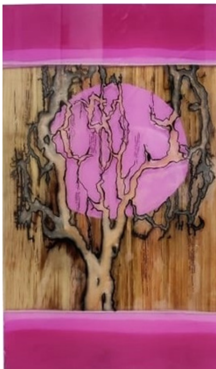
Sem título Madeira pinus, resina e acrílico 47 x 28 R$ 1.225,00

“FESTIVAL ART AVA” - Enokojima Art Center – Japão (2022).