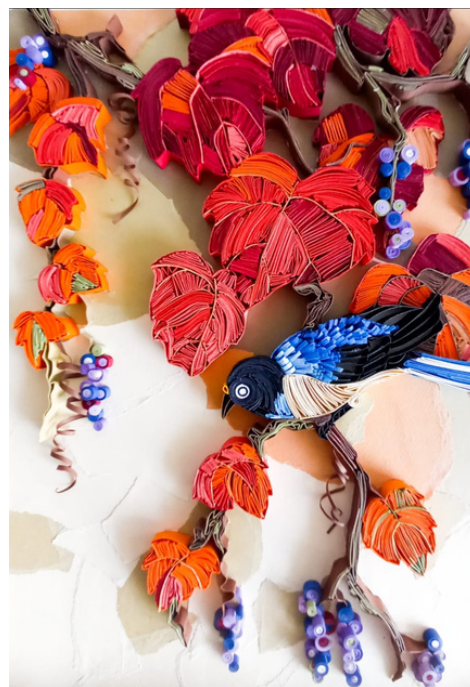
Jardim de Mirtilos Técnica quilling 40 x 30 R$ 850,00