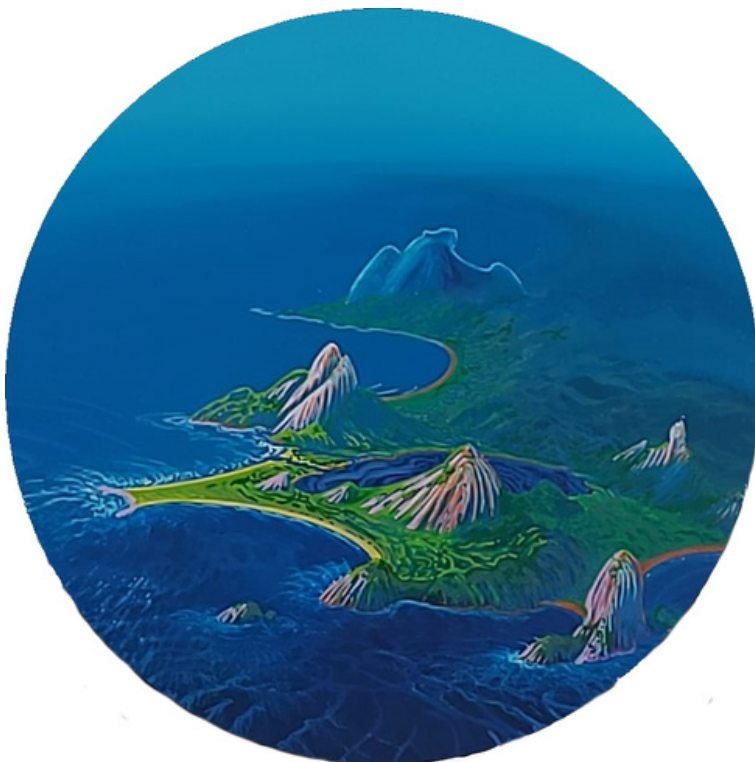
Amanhecer D'alma Acrílica sobre tela 30 cm de diâmetro R$ 2.500,00