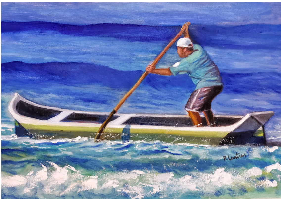
O Canoeiro Óleo sobre tela 40 x 60 R$ 1.000,00