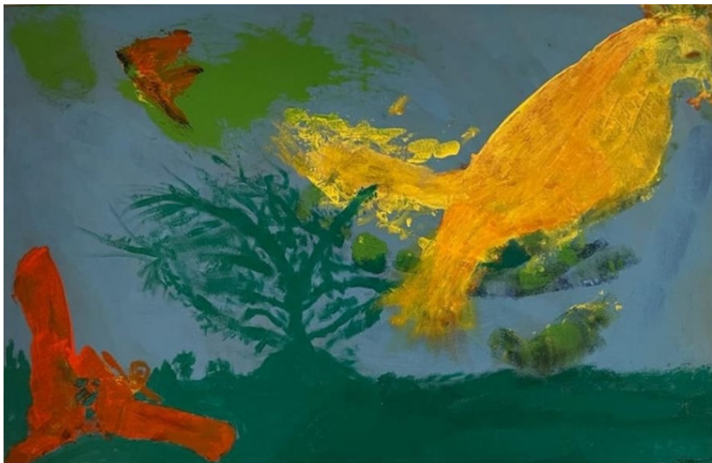
Fênix Acrílica sobre tela 60 x 90 R$ 2.200,00