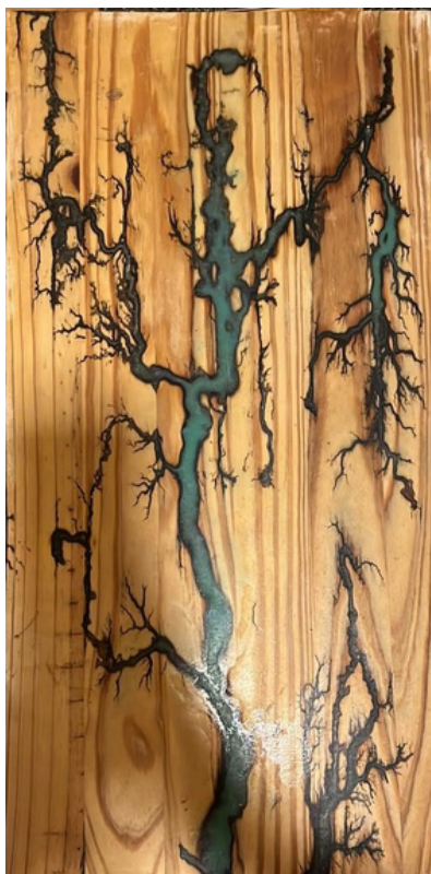
Tramas Madeira pinus e resina 30 x 59,5 R$ 1.150,00