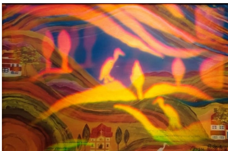
Lago no Brasil Holograma Arte 29 x 39 R$ 1.730,00