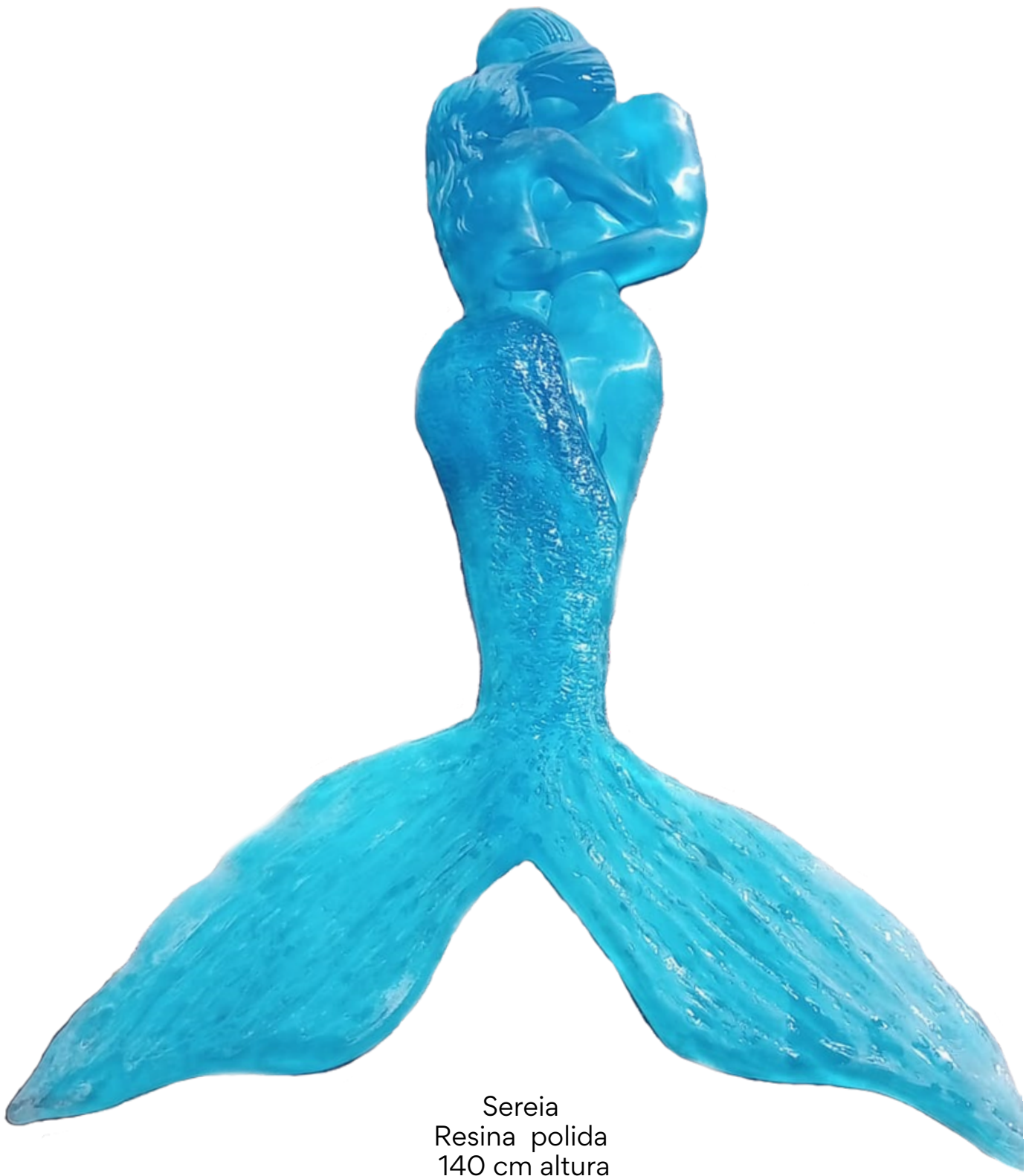
Sereia Resina polida 140 cm altura R$ 4.800,00