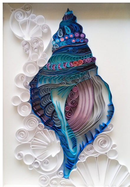
Concha azul Técnica quilling 40 x 30 R$ 750,00