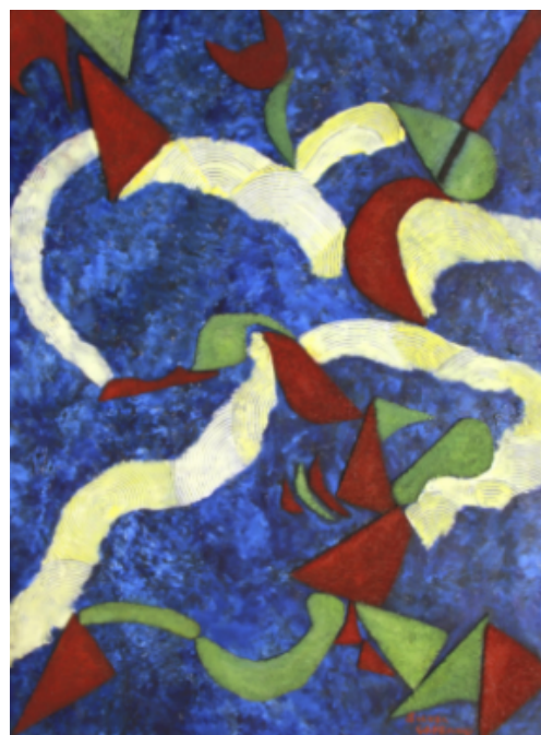
Sem título 60cm x 80cm Técnica mista (colagem e óleo s/madeira) R$6.500,00