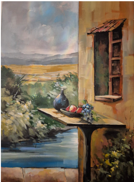
Sem título Acrílica s/tela 50cm x 70cm R$2.500,00 (Aberto a negociação)

No exterior, expôs em Roma, no Centro de Arte La Bitta (2012); nos Estados Unidos, participou de mostras na Flórida, no Museum of The Americas, e em Nova York, na Artexpo New York.