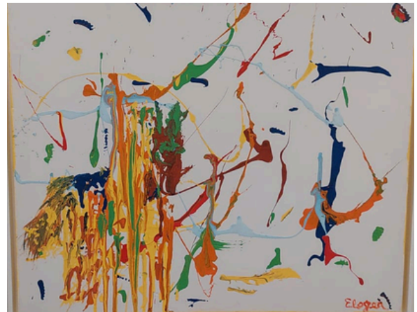
Dom Quixote (2023) Acrílica s/tela 60cm x 61cm R$ 3.800