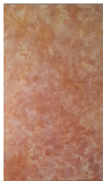
Acalanto Acrílica s/tela 50cm x 70cm R$1.200,00