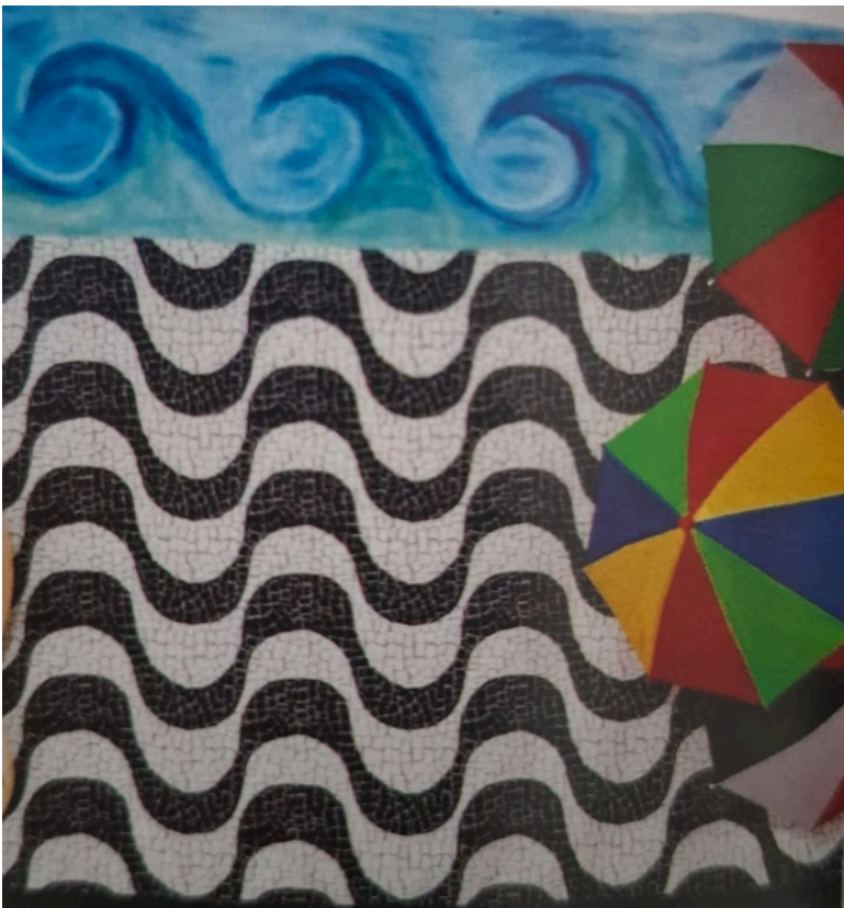
COPA Mosaico em cartão (Técnica mista) 1,29cm x 1,52cm R$800,00

Na exposição, apresenta "Três Graças" , série de desenhos e pinturas que retrata mulheres e as etnias formadoras da cultura brasileira, inspirada nas deusas gregas que simbolizam beleza, alegria e criatividade.