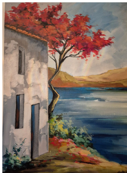
Casa sombreada Acrílica s/tela 50cm x 70cm R$2.500,00 (Aberto a negociação)