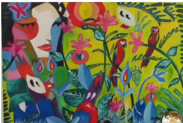
O olhar Óleo s/tela 40cm x 60cm R$ 800,00