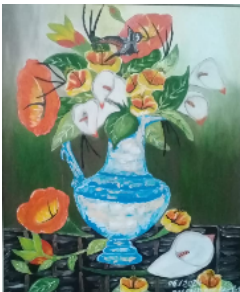
Flores Óleo s/tela com espátula e pincel 50cm x 60cm R$1.000,00