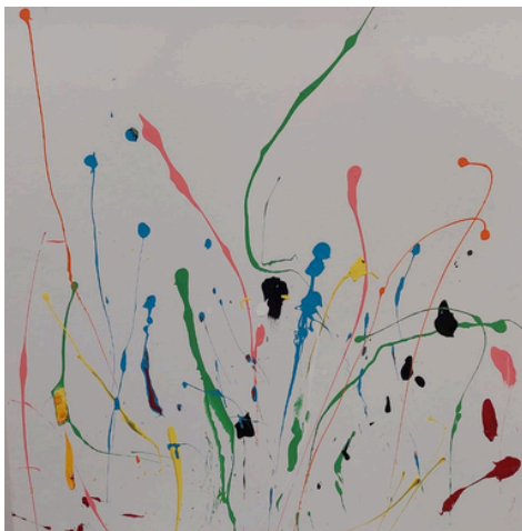
Sem título Acrílica s/tela 60cm x 60cm R$ 3.500