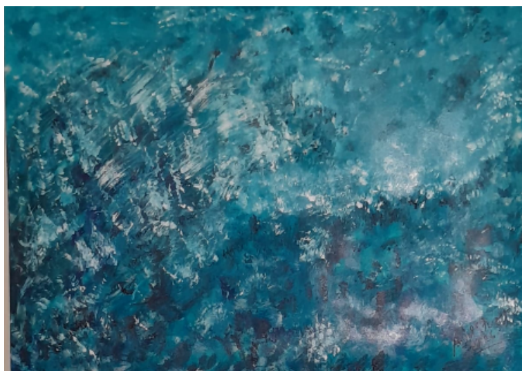
Intenso Acrílica s/tela 50cm x 70cm R$800,00

Nesse percurso, sente como se a mão divina do Criador tivesse aflorado, ou mesmo lhe presenteado, com esse dom que hoje lhe traz profunda alegria. Esse mergulho, quase sagrado, permite-lhe captar trechos, passagens e criações bíblicas, que emergem nas telas como um derramar da beleza e do Amor do Criador sobre tudo aquilo que foi criado.