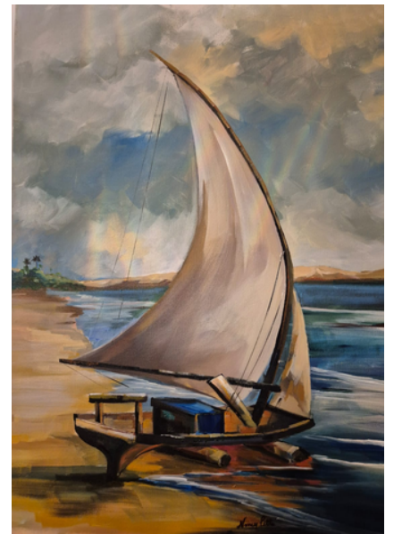
Barco Acrílica s/tela 50cm x 70cm R$2.500,00 (Aberto a negociação)