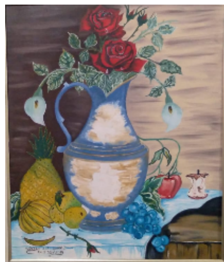
Rosa Vermelha Óleo s/tela com espátula e pincel 50cm x 60cm R$1.400,00