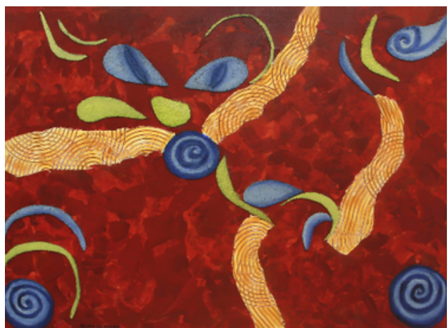
Sem título 60cm x 80cm Técnica mista (colagem e óleo s/madeira) R$6.500,00