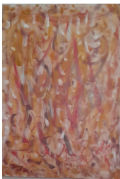
Joy (Alegria) Acrílica s/tela 50cm x 70cm R$1.200,00