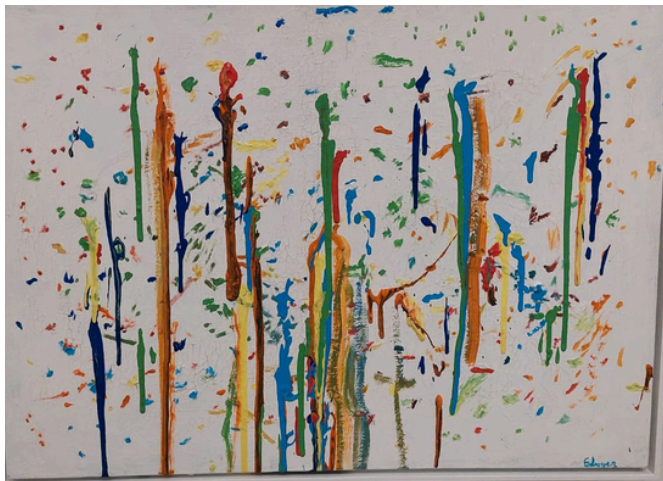
Sonho a Cor Maio 2023 Acrílica s/tela 50cm x 70cm R$ 3.500